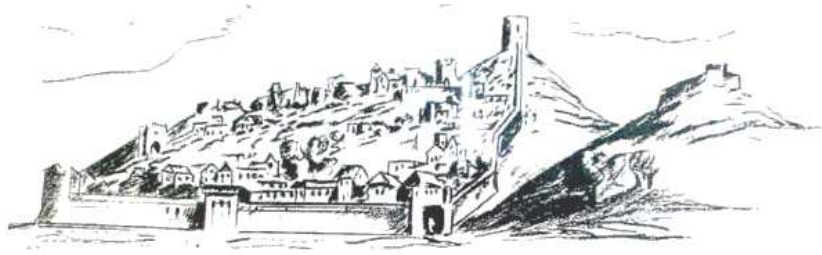
Ansicht des Ortes und der Burg aus dem 19. Jh.