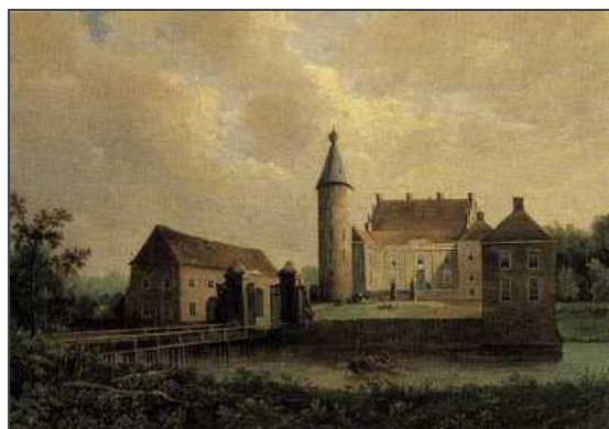
Zeichnung: Ölgemälde, M.L. Jansen

Klicken Sie in das jeweilige Bild, um es in voller Größe ansehen zu können!