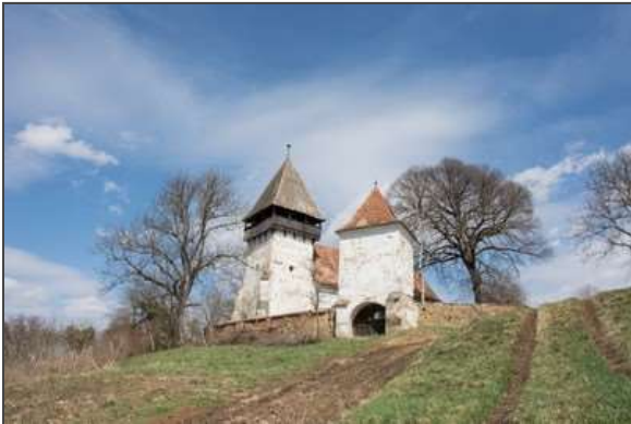
Südliche Gesamtansicht, Torbau (2022) - Kirchenburg Maniersch

Informationen für Besucher | Bilder | Grundriss | Historie | Literatur | Links