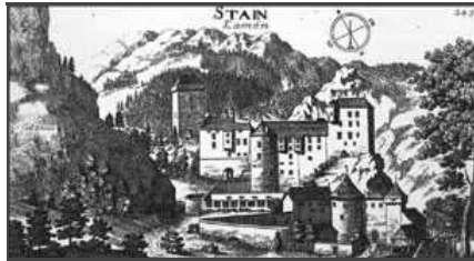
Quelle: Johann Weichard von Valvasor - Topographia Ducatus Carnioliae modernae ... | 1679.

Informationen für Besucher | Bilder | Grundriss | Historie | Literatur | Links