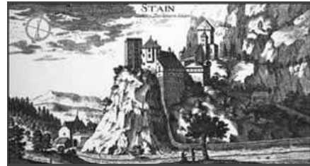
Quelle: Johann Weichard von Valvasor - Topographia Ducatus Carnioliae modernae ... | 1679.

Klicken Sie in das jeweilige Bild, um es in voller Größe ansehen zu können!