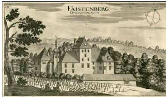
Quelle: Johann Weichart von Valvasor - Topographia Ducatus Carnioliae | 1679.

Informationen für Besucher | Bilder | Grundriss | Historie | Literatur | Links